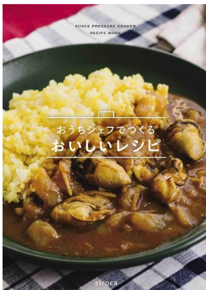
【画像】オリジナルレシピブック

おうちシェフ PRO で好評をいただいていた、日々の定番料理から作り置きおかず、世界の料理といったメニューに加え、「低温&圧力調理」で作る「牡蠣カレー」など食材そのもののおいしさを味わえるメニュー、「ベジタブルブロス」などフードロスの削減にもつながる食材を無駄にしないメニューといった、100種類の豊富なメニューを搭載。付属のオリジナルレシピブックには、オートメニューに対応する100レシピを掲載しているため、気分に合わせて「食べたい」を見つけることができ、毎日の献立選びにも役立ちます。