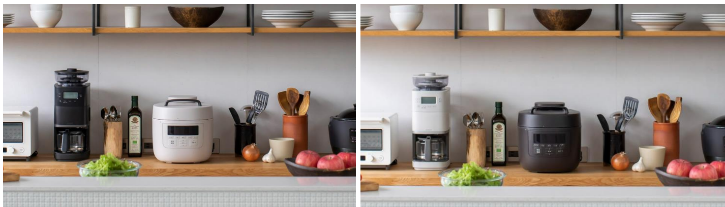
【画像】 左：SP-5D152・グレー／右：SP-5D152・ダークブラウン

より操作性に優れた SP-5D151 と、すっきりとしたデザインの SP-5D152、それぞれお好みに合わせてお選びいただけます。