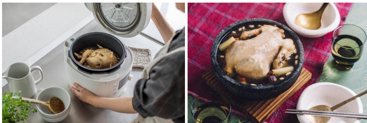
【画像】丸鶏のサムゲタン

5Lの大容量サイズで、最大6人分の料理を一度に作る事ができるため、大人数のご家庭にはもちろん、作り置きにも便利。丸鶏を使ったサムゲタンやローストチキンなど、食材をまるごと使った料理にも対応可能で、さらに料理の幅が広がります。