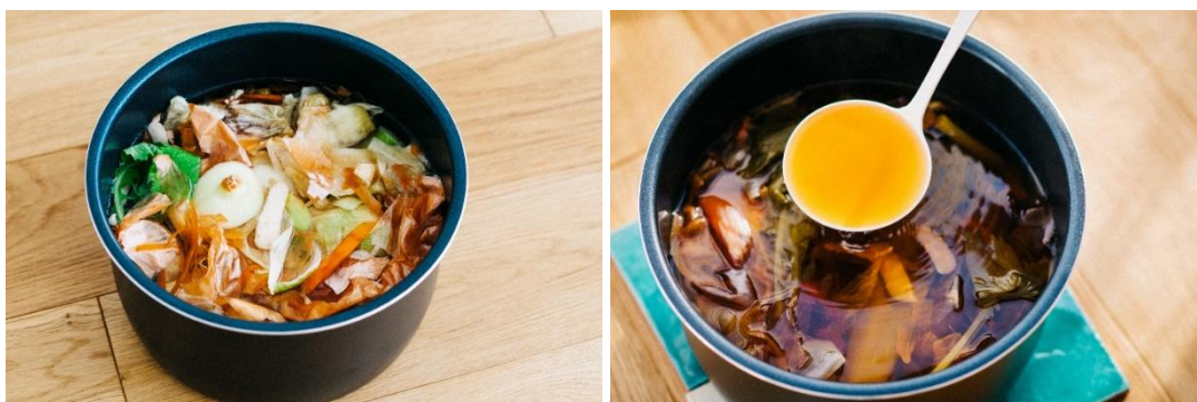
【画像】野菜の皮やすじなどで作る野菜出汁「ベジタブルブロス」