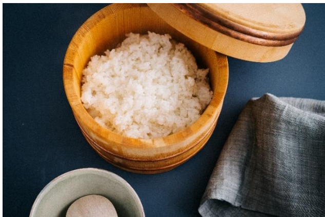
【画像】糖質オフごはん

付属の蒸しかごを使って調理する「糖質オフ炊飯」では、通常の白米に比べ糖質が約 11%オフ。糖質はおさえながらも、無理せず毎日続けやすい、おいしいごはんが楽しめます。